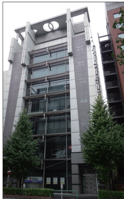
産業医科大学 東京事務所