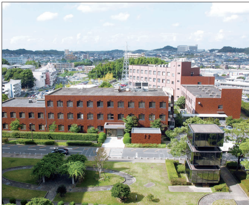
産業医科大学 産業生態科学研究所